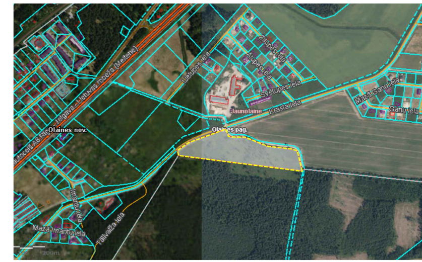
OBJEKTA NOVIETOJUMA SHĒMA