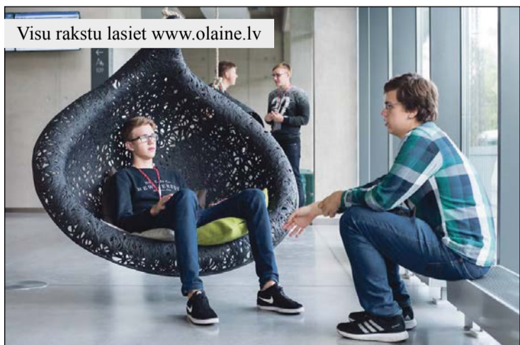
Visu rakstu lasiet www.olaine.lv

Informācijai. Eiropas Jauniešu parlaments (EJP) ir starptautisks jauniešu forums un viena no lielākajām debašu platformām jauniešiem. Eiropas Jauniešu parlaments sastāv no 40 nacionālajām organizācijām. EJP ir politiski un nacionāli neatkarīga organizācija, kuras galvenais mērķis ir veicināt starpkultūru dialogu un sociālo iniciatīvu.