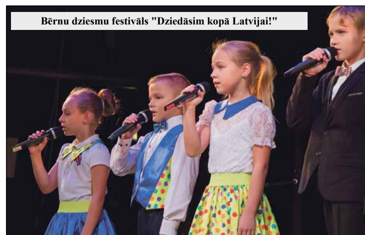
Bērnu dziesmu festivāls "Dziedāsim kopā Latvijai!"