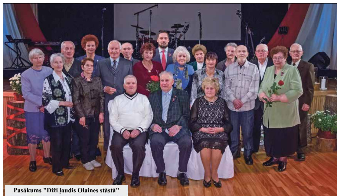
Pasākums "Diži ļaudis Olaines stāstā"