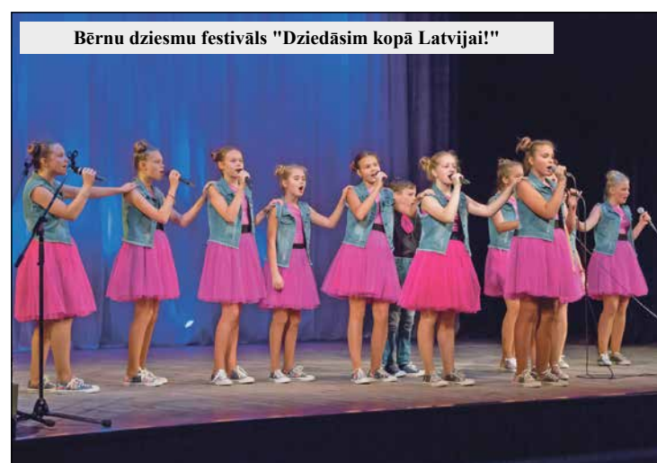
Bērnu dziesmu festivāls "Dziedāsim kopā Latvijai!"