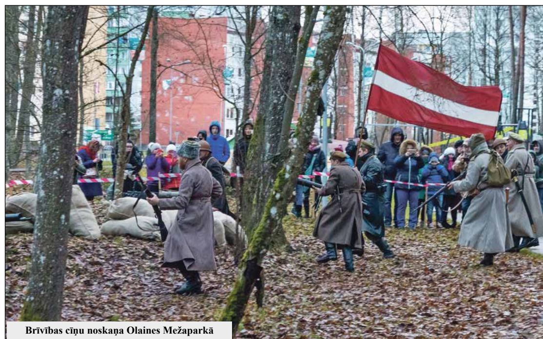
Brīvības cīņu noskaņa Olaines Mežaparkā

arī apmeklēja Olaines speciālās pirmsskolas izglītības iestādi "Ābelīte". Muzeja darbinieki aizraujoši stāstīja par Latvijas vēsturi un iesaistīja jauniešus un bērnus gan sportiskās, gan radošās aktivitātēs.