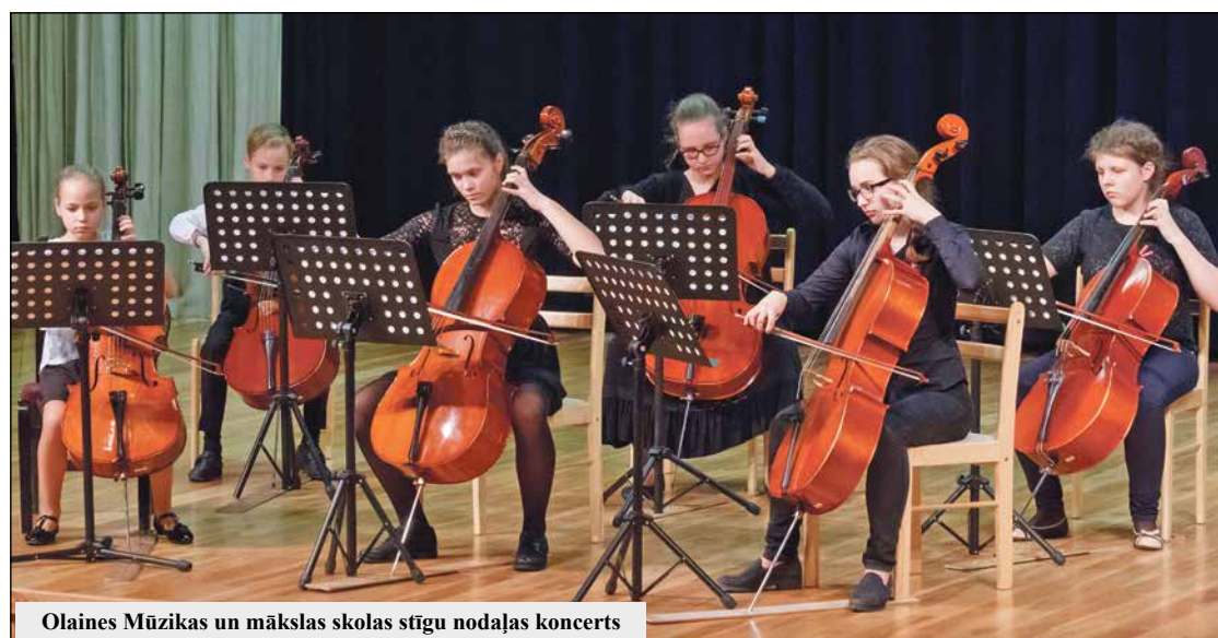
Olaines Mūzikas un mākslas skolas stīgu nodaļas koncerts