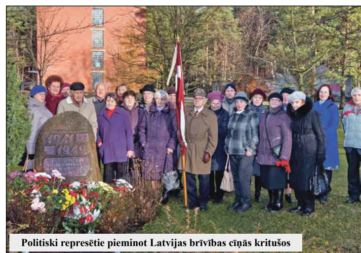
Politiski represētie pieminot Latvijas brīvības cīņās kritušos

Svētku laikā muzeja speciālisti piedāvāja nodarbības "Bermontiāde Olaines novadā", kā