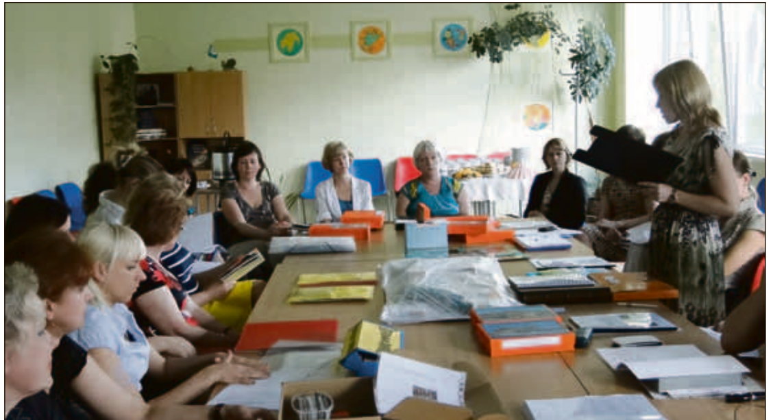
Foto no pirmsskolas izglītības iestāžu pedagogu metodisko darbu skates laureātu prezentācijas

Lai popularizētu skolotāju veikumu, izstādē ar skates darbiem trīs dienu garumā tika aicināti iepazīties visi Olaines novada pirmsskolas pedago-